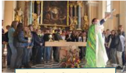
Start-Gottesdienst in St. Veit

Wir wünschen euch Firmlingen noch inspirierende und glaubensvertiefende Begegnungen und Erlebnisse hin zur Firmung und danach das spürbare Wirken des Hl. Geistes in und durch euch.