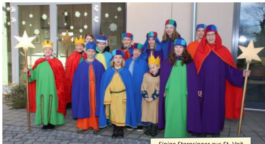
Einige Sternsinger aus St. Veit