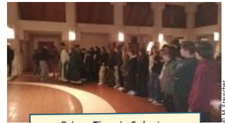
Prime-Time in Salvator