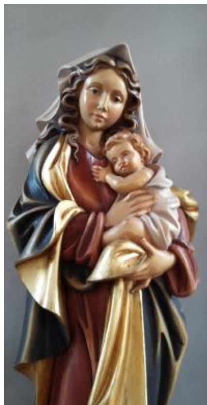
Madonna mit Kind, Kapelle Stettlegg

Feiern Sie die Maiandacht in unseren Pfarren mit! Die Termine finden Sie im Kalender auf den Seiten 12–13.