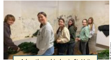
Adventkranzbinden in St. Veit