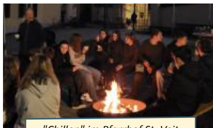
"Chillen" im Pfarrhof St. Veit