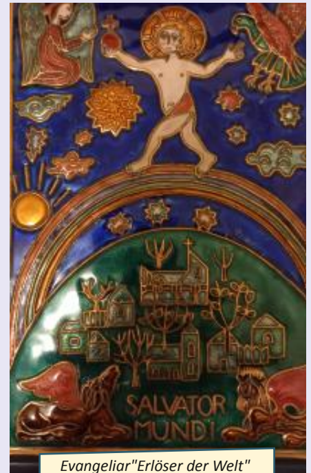
Evangeliar "Erlöser der Welt" aus der Pfarre Salvator. Emaillearbeit von Agnes Bartha

https://www.jesus.ch/themen/wissen/wissenschaft_und_forschung/314128-neurooekonomen_grosszuegigkeit_macht_menschen_gluecklicher.html