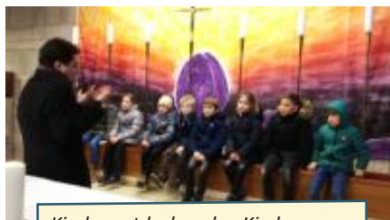
Kinder entdecken den Kirchenraum