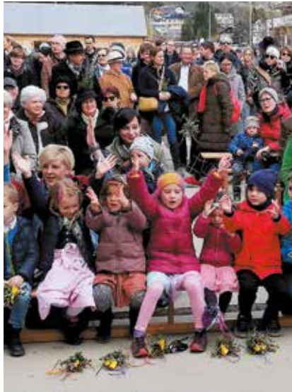
Palmsegnungen und Osterspeisensegnungen