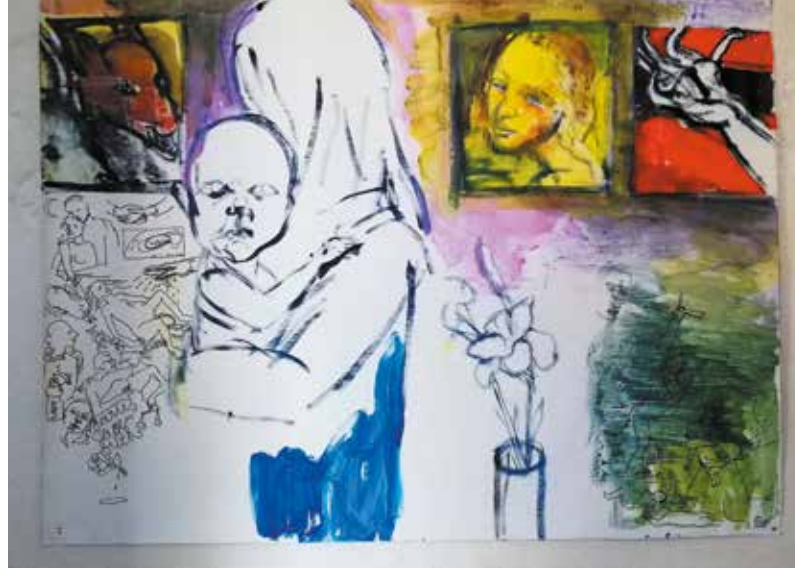
ANIMA - Zum Nachdenken über die Un-Ausgeglichenheit, Sehnsüchte und Hoffnungen der Gefühlswelt und des Seelenlebens luden die Bilder von Anne Lückl ein.